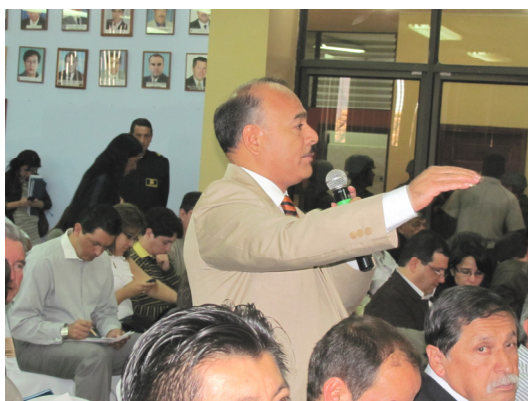
Pedro Quito Alcalde de Macará de Izquierda Democrática