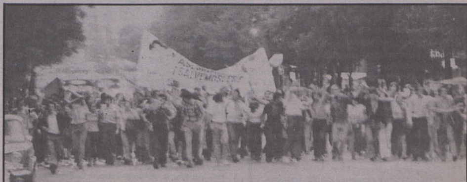
manifestação em Espanha de resposta ao assassinio dos camaradas da ETA e da FRAP

O assassinato dos cinco antifascistas espanhóis ordenado pelo tirano Franco foi a culminação do agravamento da situação política espanhola que começou a acentuar-se à cerca de um ano.