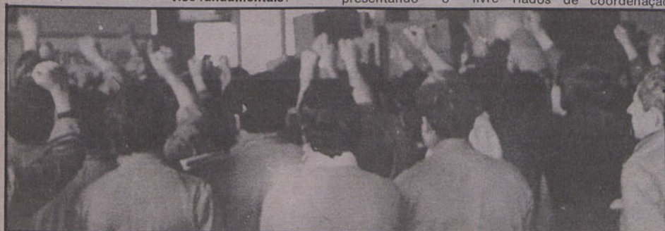
Falta de inserção da luta urbana na luta dos trabalhadores.

1.3 — Em nossa opinião, existem cinco desvios fundamentais: