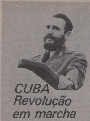
CUBA Revolução em marcha