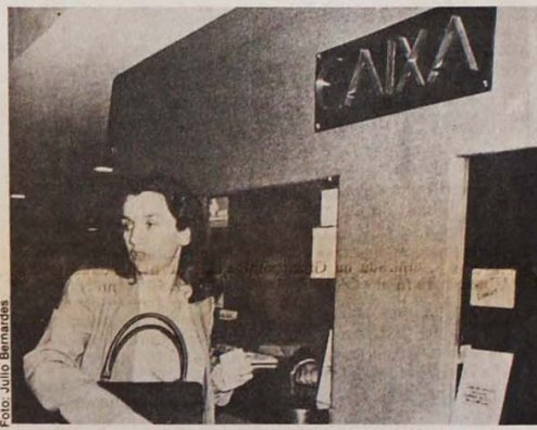
A sra. Jul, na sua missão atual, força a dominação do sistema financeiro

Um dos principais resultados da atual visita do FMI se materializou na última reunião do Conselho Monetário Nacional, realizada no dia 22 de agosto. Suas decisões principais: cortar subsídios à exportação e começar a "reforma bancária". Ora, que autoridade moral tem um governo no apagar das luzes para fazer uma reforma qualquer? Ainda mais num setor dominante. Estranho esse impeto "reformista" de Figueiredo. O objetivo é enfraquecer o Banco do Brasil e preparar terreno para a entrada direta dos bancos americanos. Não há dúvidas de que o sistema financeiro do país tem de ser mudado, mas quem tem de decidir é a nação, democraticamente.