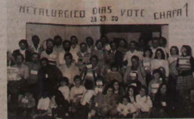
Chapa 1 tem apoio de sindicalistas e de operários gaúchos