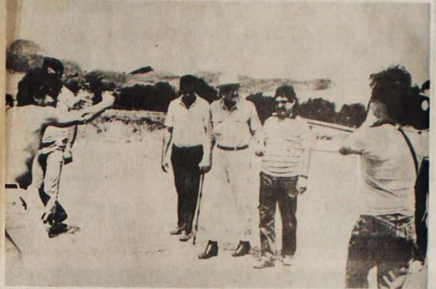
As filmagens de "Evangelho Segundo Teotônio", censurado pelo governo

A Censura Federal não está permitindo a exibição do filme "Evangelho Segundo Teotônio", de Wladimir de Carvalho. O filme seria exibido em Brasília, no último dia 13, e em São Paulo, no dia 17, e aborda aspectos da vida e do pensamento do senador Teotônio Vilela.