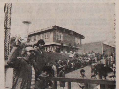
Na Randon, o sanduíche que os operários não comeram.

Sem conseguirem um acordo com a Randon, os operários decidiram realizar o boicote ao almoço no dia 15. Alertada, a empresa começou a pressioná-los, ameaçando demitir os boicotadores. No dia 15, o Sindicato distribuiu lanches sanduíches na fábrica. Um bom número de operários não almoçou na Randon. Foram distribuídos sanduí-