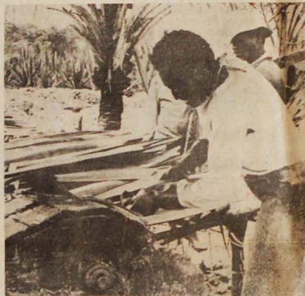
O motor paraibano, junto com a fibra, decora carne humana.

Até 1979, a aposentadoria era possível, através do Funrural, mas o Inamps baixou normas nacionais regulamentando a aposentadoria, obrigatórias para os médicos e desde então nenhum mutilado conseguiu aposentar-se. Quem explica isso é o coordenador-geral dos bene-