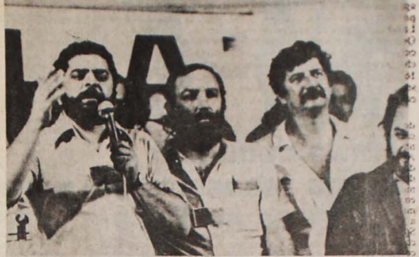
Congresso de agosto passado: líderes petistas fundam sua central sindical divisionista

HEGEMONIA NA MARRA O "atrelamento da CUT ao PT é claro: ligase todos os membros da sua coordenação nacional aos sindicalistas filiados ao partido. No próprio encontro uma pesquisa revelou que 90% dos entrevistados havia votado no PT nas eleições de