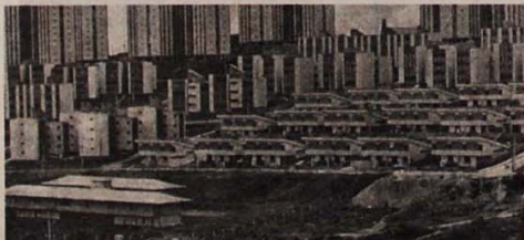
Os recursos de interesse social do BNH não chegam a 40%