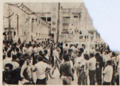
Os funcionários da Light se concentraram em frente ao Sindicato