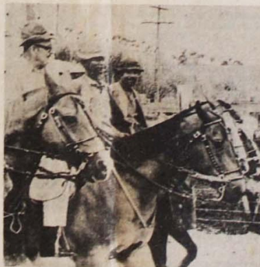
O Senador da Anistia, mesmo morto, incomoda o regime