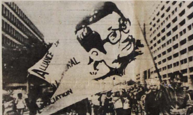
O assassinato de Benigno Aquino desencadeou manifestações gigantescas contra a ditadura de Marcos