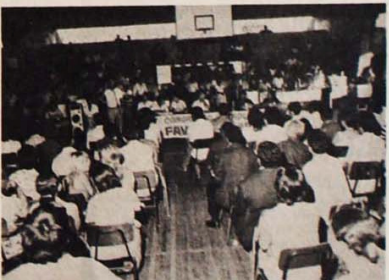
Cerca de mil pessoas presentes ao I Congresso dos favelados

A grilagem e a violência no campo merecem atenção num Estado como a Bahia, onde só em 1983 tivemos 15 assassinatos de posseiros e 2 de assalariados em conflitos que envolvem 780 famílias de posseiros. E este ano não está deixando por menos, com grileiros e latifundiários cometendo crimes abomináveis para aumentar suas propriedades e especular com a terra. Urge levantar a origem, quem pratica, o número de casos, as características, e como combater e acabar com a grilagem e outras violências, pois o problema fundiário e agrário na Bahia e no Brasil não é policial e militar, como quer o governo, mas político. Faz-se necessário, portanto, que os delegados ao I Congresso Estadual de Trabalhadores Rurais da Bahia e ao IV Congresso Nacional entrem preparados, elaborem teses em linguagem simples e direta, mas cheias de informações e com propostas. Além das apresentadas formalmente pela Fetag, os delegados apresentarão teses sobre todos os temas, elaboradas em seus sindicatos, discutidas e enriquecidas em suas bases, para que sejam inscritas no Congresso e debatidas para assegurar o êxito dos Congressos Estadual e Nacional.