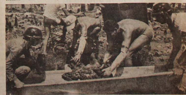
Vila Socó, fevereiro de 84: um dos mais de 500 cadáveres de favelados é retirado do local do incêndio