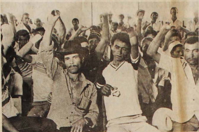
Na encontro dos trabalhadores do sisal na Bahia, dois terços tinham mãos, dedos, braços decepados.