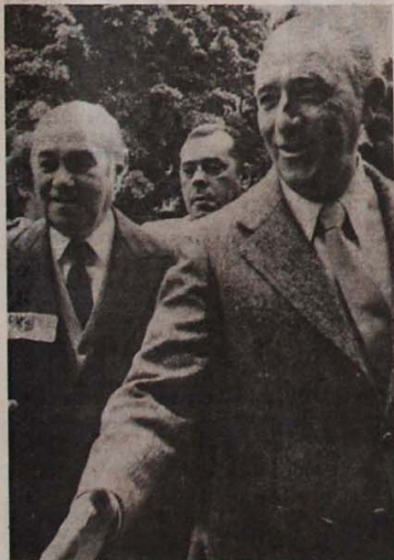
Tancredo e Montoro na inauguração da sede do PMDB

Pedidos com o envio de cheque nominal, no valor da compra, para Editora Anita Garibaldi, av. Brig. Luís Antônio, 317, 4º andar, sala 43. CEP 01317 - Fone 34-0689 - São Paulo - SP.