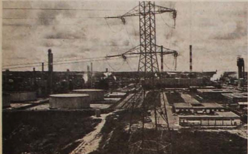
Os operários se preparam para a greve no Pólo Petroquímico da Bahia

A repressão feroz ao movimento paradedista corre paralela a uma campanha suja da imprensa burguesa que visa culpar os rodoviários pelos constantes aumentos nas tarifas dos ônibus. Numa reunião no dia 21 o movimento popular exigiu o cumprimento da lei que determina que o preço das tarifas seja estipulado pela Câmara Municipal e não pelo prefeito. Segundo um levantamento, a tarifa de fevereiro para cá aumentou 275%, enquanto os salários dos rodoviários desde agosto de 1982 só foi reajustado em 176%, o que prova a mentira patronal. (da sucursal)