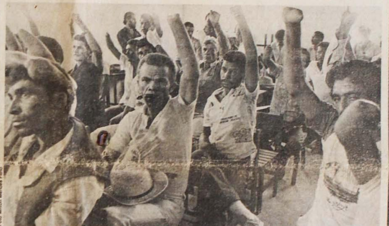
INPS não aposenta quem perdeu uma mão na desfibradetra: tem que ter perdido as duas mãos!

Mutilados do sisal na Bahia exigem aposentadoria. Pág. 10