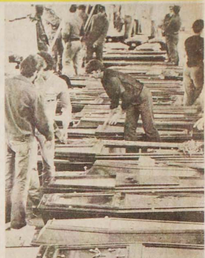
Os atouros dos petroleiros mortos na tragédia de Enchova

Desta maneira, a Petrobrás, conquistada pelo povo brasileiro na memorável campanha de massas do "Petróleo é Nosso", afunda sempre mais no mau caminho em que foi colocada pelo regime militar entreguista e por sucessivas administrações de generais e tecnocratas (Gerson Marques e Maria do Rosário — Rio de Janeiro)