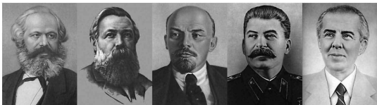
Karl Marx, Friedrich Engels, Vladimir Lenin, Joseph Stalin, Enver Hoxha 5 C l a s s i c s o f M a r x i s m